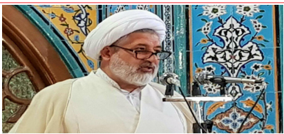
امام جمعه میانه: تمامی قوانین و پیشنهادات هیئت دولت باید از پشتوانه عقلانی برخوردار باشد