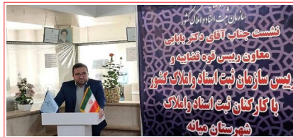
حضور دکتر بابایی معاون رئیس قوه قضاییه و رئیس سازمان ثبت اسناد و املاک کشور در میانه