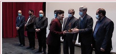
مراسم تجلیل از برگزیدگان میانه ای جشنواره سراسری جوان و موغام