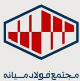
مجتمع فولاد میانه

سنگین فولادسازی با ظرفیت ۲۴۰ (۳۲۰) ton گردید. وی همچنین افزود در ماه جاری سایر جرثقیل‌های سنگین از جمله جرثقیل Scrap Yard به ظرفیت ۲۰ ton و جرثقیل CCM به ظرفیت ۸۵ ton نصب گردیده است و طبق برنامه ریزی‌های صورت گرفته تا پایان سال جاری سایر ملحقات جرثقیل اصلی این واحد نصب خواهد گردید.