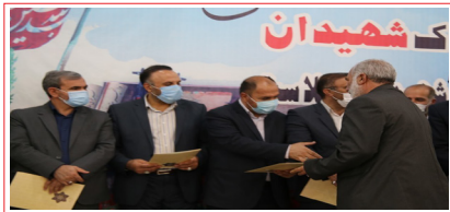
آیین تجلیل از خانواده های محترم شهدا، آزادگان و جانبازان معزز ادارات آموزش و پرورش