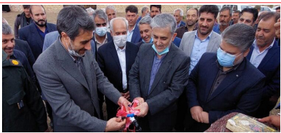
بهره برداری از طرح آبرسانی به روستای ارس میانه