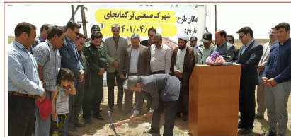
کلنگ زنی کارخانه مینی بیل مکانیکی چندکاره در ترکمانچای