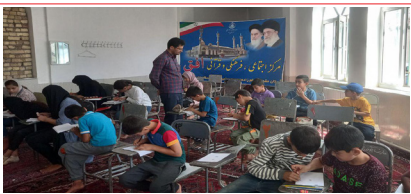
برگزاری بیش از ۵۰ کلاس طرح اوقات فراغت در سطح شهرستان میانه