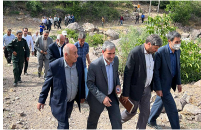
روابط عمومی بخشدار کاغذکنان